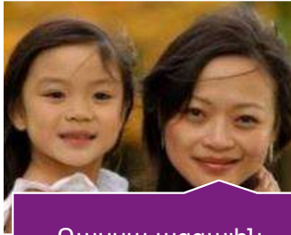
Ռասա ազգային պատկանելություն