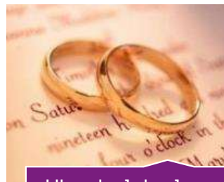
Սեռական կյանքը կամ կողմնորոշումը